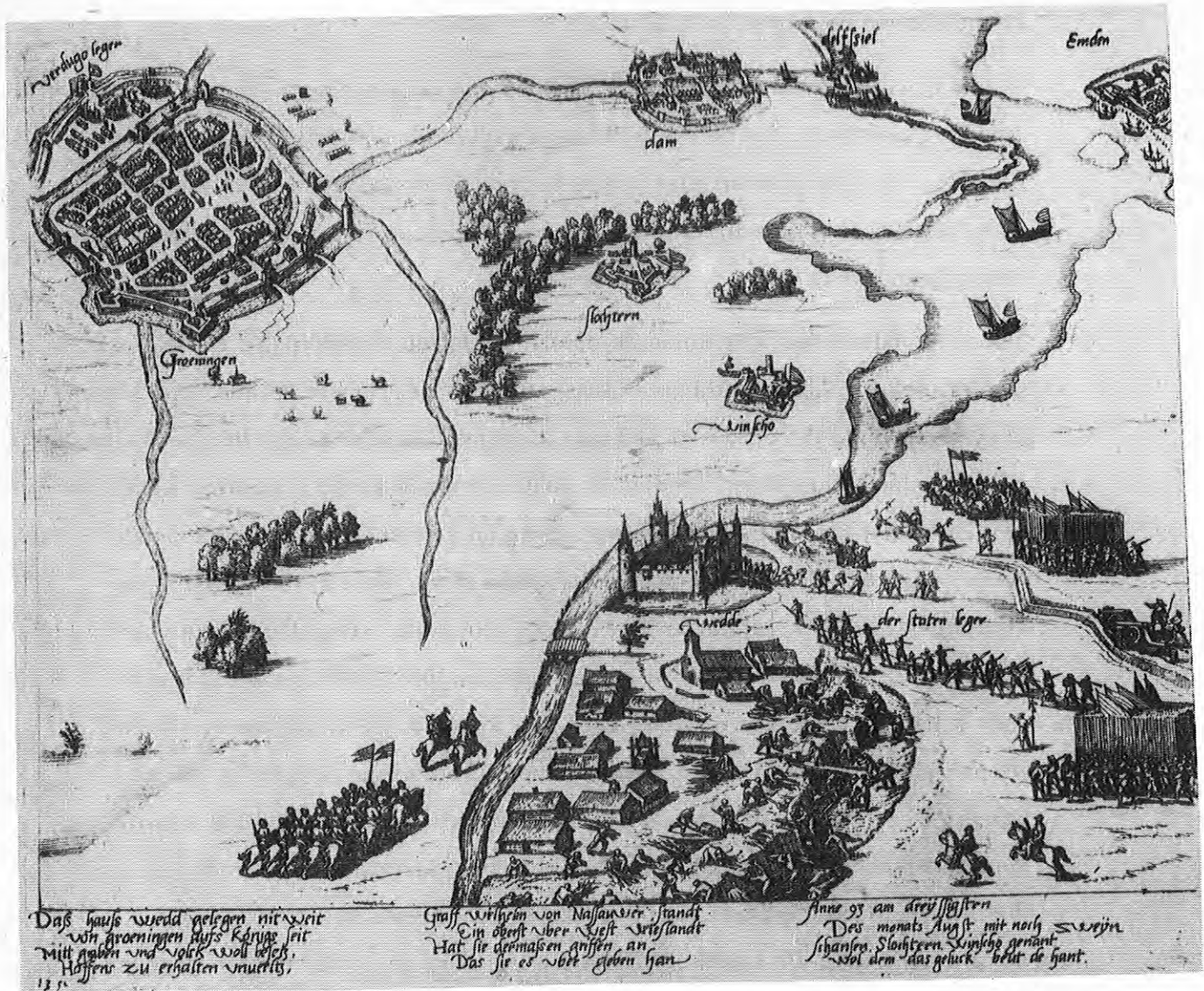
30 augustus 1593 Willem Lodewijk van Nassau veroverf de Wedder Burcht