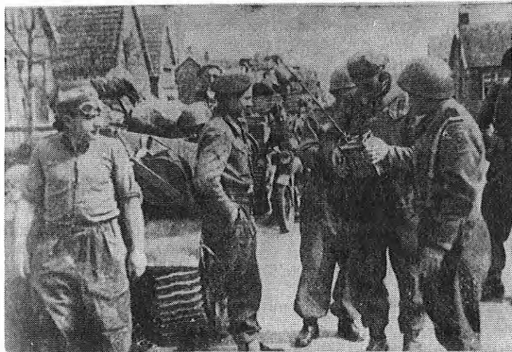
Onstwedde wordt bevrijd! Poolse troepen in de Luringstraat te Onstwedde. Volgens het Poolse oorlogsverslag is de foto genomen om 12.15 uur op 13 april 1945. Om 13.25 uur vond het gevecht in Tange plaats, waarbij 9 Duitsers sneuvelden.